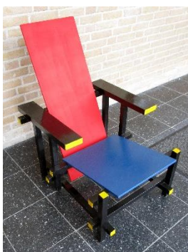
1919: de bekende rood-blaauwe stoel van Gerrit Rietveld voor het eerst getoond

Museum Nagele ziet als haar taak niet alleen de promotie van de cultuurhistorische waarde van het dorp en het verhaal daarachter: het ontwerp en de realisatie van Nagele. Ook is er vanzelfsprekend aandacht voor de context, voor wat eraan vooraf ging: het tijdens een zware stormvloed omstreeks 1300 verdronken Nagele, het IJsselmeerproject en de drooglegging van de Noordoostpolder. De promotie gebeurt o.a. via persberichten, interviews, verspreiden van folders, aansluiten bij thema's en natuurlijk via persoonlijk netwerken.