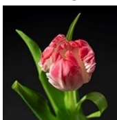
Parot, Alice Valk

VakFotograaf Alice Valk toont tijdens het Tulpenfestival (10 april t/m 5 mei) diverse tulpenfoto's. Daarnaast zal een vitrinekast gevuld met kleine gedroogde tulpenwerkjes deel uitmaken van de expositie. Hier wordt de tulp vanuit een ander perspectief zichtbaar. Alice Valk woont in Rutten. Zij is in 2019 afgestudeerd aan de Fotovakschool in Apeldoorn.