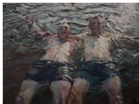
Washed Ashore, M.J.van Santen

Martin-Jan van Santen is een echte schilder die de verf laat meespreken in zijn werk. In zijn impressionistische schilderijen in olieverf zit een bijzondere lichtval, of juist een stemmige en sferische belichting. Zijn schilderwerken bestaan veelal uit portretten, landschappen en situaties. De personen, meestal mannen, lijken in gedachten verzonken, te dagdromen en ademen een sfeer van stilte en rust. Opvallend bij al zijn motieven is het natuurlijke van zijn figuren. Niet poserend, maar in een moment vastgehouden. Naast kunstschilder is Martin-Jan regisseur, scenarist en stem acteur. In januari 2020 heeft hij een animatiefilmpje gemaakt, Robert de Robot, waarin hij uitlegt hoe Nagele helemaal energieneutraal kan worden gemaakt.