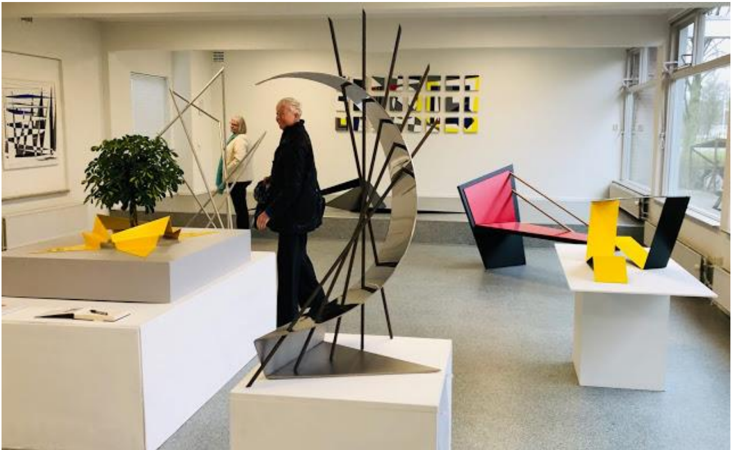
Overzicht expositie in Museum Nagele 'H.P. Smithzaal'.