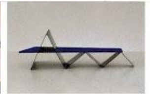
Blue Wave Foto Museum Nagele