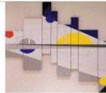
Zonder titel

Boeiend is het om te zien hoe er in een zo abstracte vormtaal zoveel persoonlijke emotie gelegd kan worden.