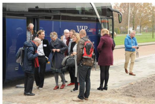
Bezoek RCE.

Samenwerking was één van de idealen van de architecten van 'De 8' en 'De Opbouw'. Ook voor het bestuur van Museum Nagele is samenwerking belangrijk, zoals in het voorwoord al genoemd de samenwerking met bijvoorbeeld de Rijksdienst voor het Cultureel Erfgoed (RCE). In 2016 verschenen bij het RCE in verband met de aandacht voor de Wederopbouwperiode o.a. de publicaties 'Nagele. Een moderne erfenis' en 'Een toekomst voor (wand)kunst in Nagele'. Aan beide publicaties hebben vrijwilligers van Museum Nagele bijdragen geleverd.